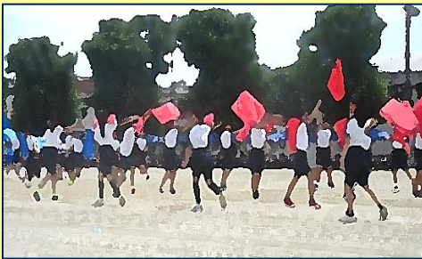
【5・6年生】『みんなでつながる、ありがとうの輪』～4色旗による集団パフォーマンスと表現運動 & パラエティーリレー～