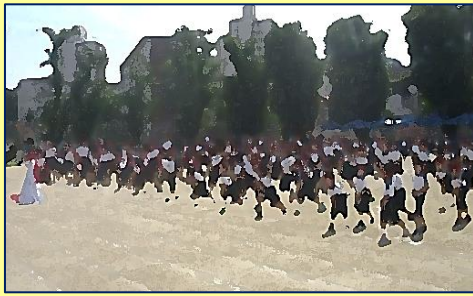
【全校児童】準備体操も真剣！