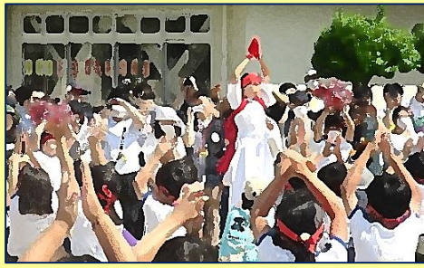
【赤組団】応援合戦(団結賞)