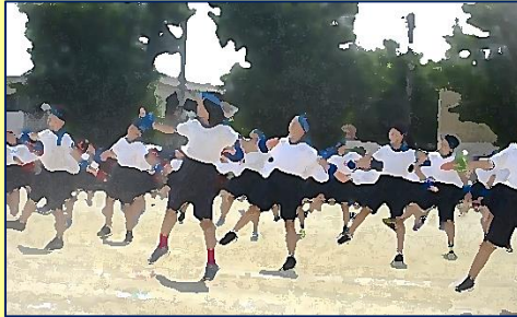
【3・4年生】『みなミックスナッツ～サンバを添えて～』(演技 & 競技)