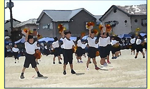
【1・2年生】『南っ子 わたしたちの新時代』