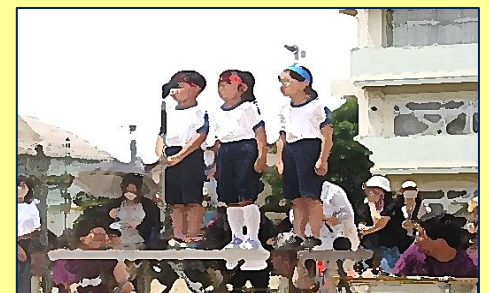
【閉会式】『2年生代表 終わりの言葉』