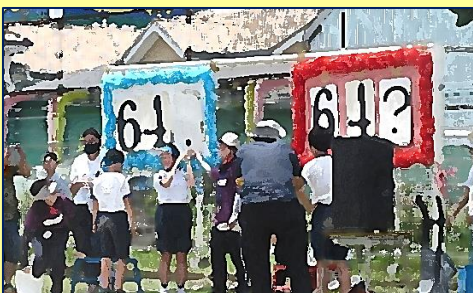
【閉会式】『青組・紅組 得点発表』