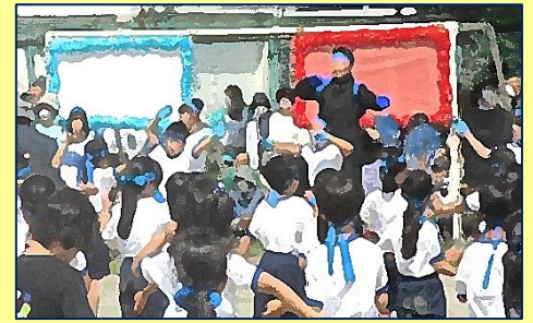
【青組団】応援合戦(アイデア賞)