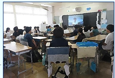
《南小・オンラインによる朝会の風景》