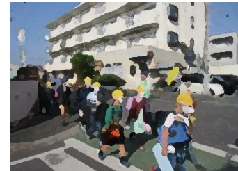
〔登下校の見守り活動〕