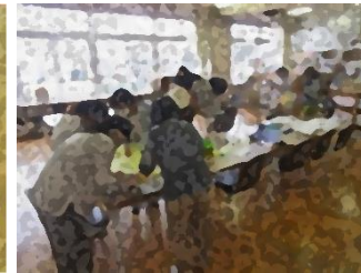
〔本の修繕や季節に合わせた飾りつけ〕