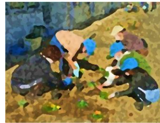
〔環境・美化委員会との植栽活動〕