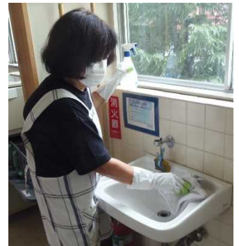
校務員による消毒