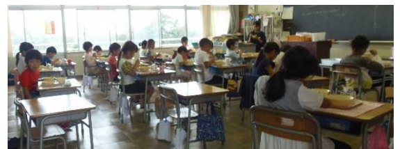
前を向いての給食風景

以上の感染対策は、三芳野っ子一人ひとりを守るため、三芳野っ子の家族を守るためのものです。家庭におかれましても、感染を予防する行動をお願いします。