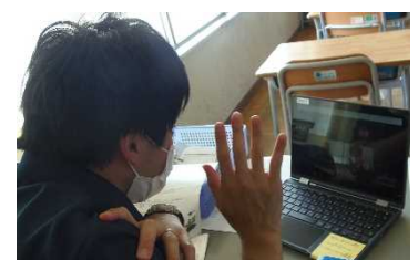
8.30 学習用端末接続調査

8月30日の午後、家庭で学習用タブレット端末をネットにつなぎ、学校の担任と接続状況を確認する調査を行いました。今後のオンライン学習等を見据えた接続調査でした。お忙しい中、ご協力いただいた保護者の皆様には、心より感謝申し上げます。