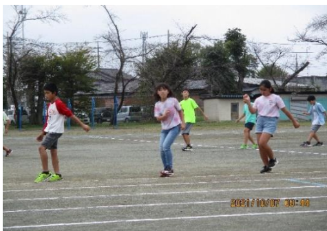
5年生「はじけろ! ダイナマイト」