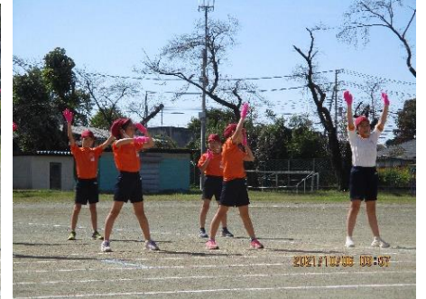
3年生「脂肪燃焼カーニバル」