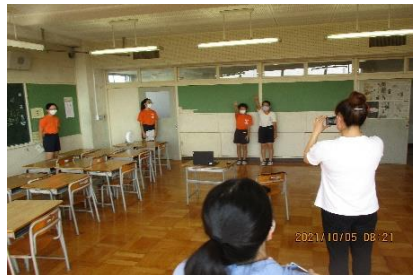
開会式 (Meetで校内配信)