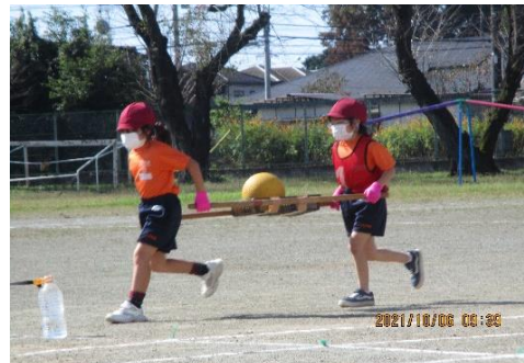
3年生「オーヤーイツ」