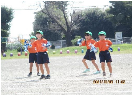
2年生「あいうえおんがく」