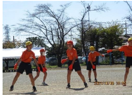
4年生「脂肪燃焼カーニバル」