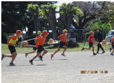
4年生「オーヤーイツ」