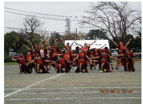
6年生「絆2021～ラストピース～」