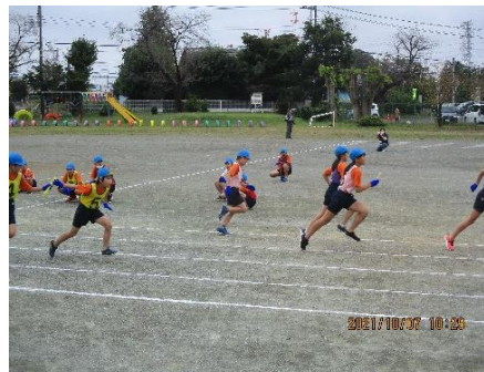
6年生「バトンをつないで走りくるえ!!」