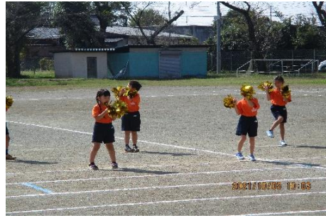
1年生「あいうえおんがく」