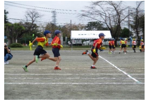
5年生「チームでつばしれ チーム対抗全力リレー」