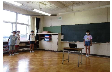
閉会式 (Meetで校内配信)