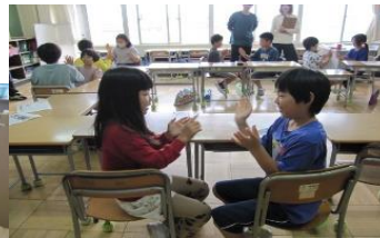
【おはぽな学級のペア学習】