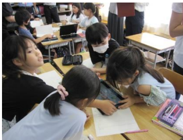
【3年生のグループ学習】