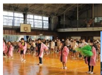
4年生が応援をリード↑