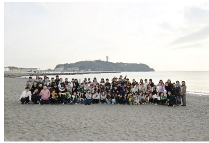
6年生「片瀬江ノ島海岸」にて

延期されていた修学旅行に行ってきました。冬の鎌倉や江ノ島、小田原城にて、6年生達は、どのグループも時間を守り、協力して活動することができました。