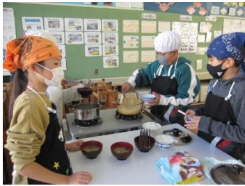
5年生「ご飯とみそ汁作り」

透明な鍋を使い、米の炊ける様子を観察しながらグループで協力し実習を行いました。6年生は、献立から考え「朝食に合うおかず」を作りました。