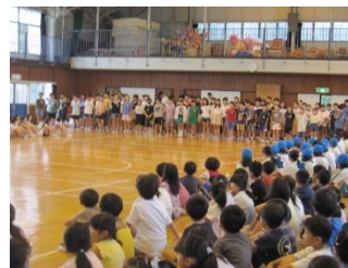
【低音パートを歌う高学年】

久しぶりに全校での音楽朝会です。「翼をください」の大合唱。子どもたちの元気な歌声が体育館中に響き渡りました。5,6年生の歌声がよいお手本です。