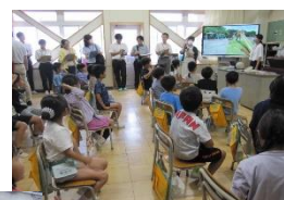
【児童同士が繋がることで学びを深めます】

今年度、坂戸市では「学びづくり研修会」を行っています。(主体的・対話的で深い学びの実現に向けての授業改善を図ります)写真は2年1組の道徳の授業です。市内の多くの先生方にも公開し、共に学びました。