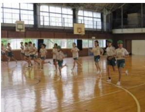
【6年生・シャトルラン】

自分の限界に挑戦！昨年度の記録より伸ばし“成長”を感じた高学年。桜小児童の体力の課題は敏捷性(動作の素早さ)・走力・持久力です。