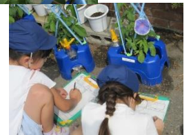
「アサガオがさいたよ」・1年生 生活科